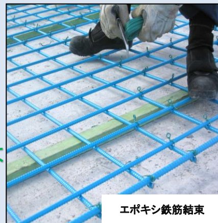
エポキシ鉄筋結束